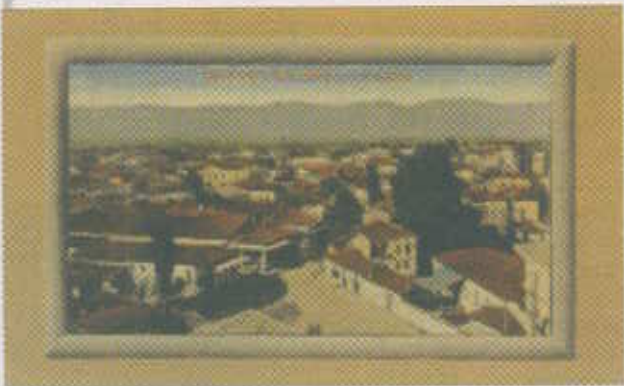
1: Πανοραμική άποψη της Καρδίτσας γύρω στα 1905, σε φωτογραφία που τραβήχτηκε από τον τρούλλο του Αγίου Κωνσταντίνου. Στο βάθος και αριστερά διακρίνεται η Κεντρική πλατεία και το ξενοδοχείο "Ωραία Ελλάς", όπου είναι σήμερα το κτίριο "Παλλάς". (Από καρτ -ποστάλ έκδοσης Σ. Στουρνάρα)

Της Ζωοδόχου Πηγής και του Αγίου Κωνσταντίνου