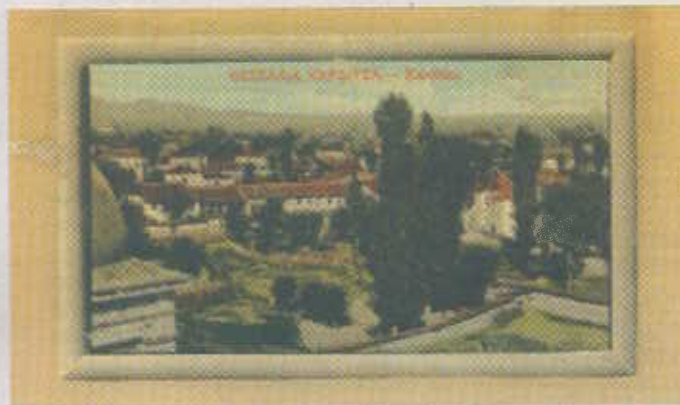
2: Άποψη του Β.Δ. μέρους της Καρδίτσας, σε φωτογραφία που τραβήχτηκε από τον τρούλλο του Αγ. Κωνσταντίνου γύρω στο 1905. Διακρίνονται κάποια από τα λειβάδια που βρίσκονταν βόρεια του Ναού.

Μετά μεσημβρίαν, η πανηγύρις έλαβε ζωηρότερον χαρακτήρα. Το πλήθος συνήλθεν εις την έμπροσθεν της Μητροπόλεως πεδιάδα (αλώνια) και επλήρωσεν τον ευρύτατον εκείνον χώρον. Εκεί, αι ανθηραί και ροδόχροοι γκαργκούνισσαι έχόρευσαν εν συμπλέγματι κανονικότητα τον κυκλικόν χορόν των υπό τον ήχον του τυμπάνου με τας ωραίους αυτών γραφικάς περιβολάς και τα εγχώρια κοσμήματά των. Αβραί δε δέσποιναι και δεσποινίδες πολιτών εθεύοντο τας χορεύουσας καλλονάς και πλήθους άλλου κόσμου. Δεν έλλειψε δε κατά την ημέραν ταύτην και η πάλη, ης νικητής ακαταδά-