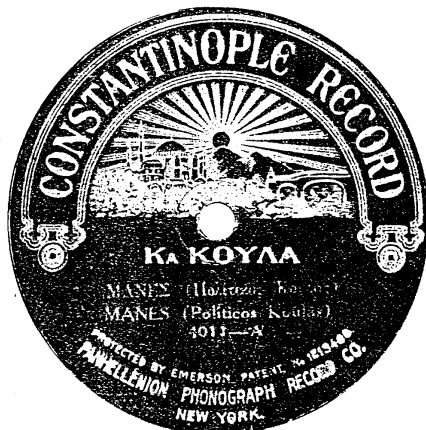
- Ετικέτα δίσκου της εταιρείας "Constantinople Record", που περιέχει το τραγούδι "Μανές Πολίτικος" της Κούλας.

Στη συνέχεια Διον. Μανιάτης, στο βιβλίο του "Οι Φωνογραφιτζήδες" 5 , παρουσιάζει ένα σύντομο βιογραφικό της Κούλας. Σ' αυτό επαναλαμβάνει, σχεδόν κατά γράμμα, τις πληροφορίες του St. Frangos, χωρίς όμως να αναφέρει την προέλευσή