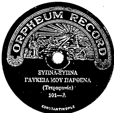
- Ετικέτα δίσκου της εταιρείας "Orpheum Record", που περιέχει το τραγούδι "Ξύπνα - ξύπνα γλυκεία μου παρθένα", ηχογραφημένο στην Κωνσταντινούπολη.