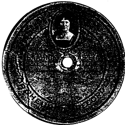
- Ετικέτα δίσκου της εταιρείας δίσκων "Orpheum Record".

Μελέτησα προσεκτικά το άρθρο και πουθενά δεν ξεκαθαρίζεται ποιο όνομα είναι το πατρικό της και ποιο του συζύγου της. Συγκεκριμένα μία φορά αναφέρεται στο άρθρο σαν "Γιορτζή - Αντωνοπούλου" και τρεις φορές σαν "Αντωνοπούλου". Σαν μικρό όνομα του συζύγου της αναφέρεται το "Ανδρέας".