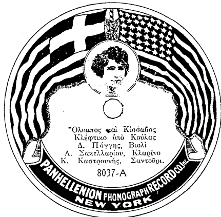
- Ετικέτα δίσκου της εταιρείας "Panhellenion Record", με διαφορετική εικόνα της Κούλας.

Record". Έχει επίσης πολλές παραλείψεις σε τραγούδια της ηχογραφημένα στην εταιρεία "Panhellenion Record".