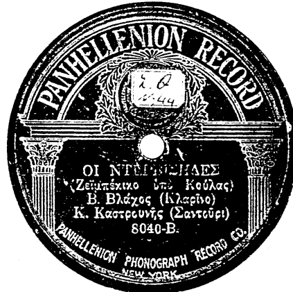
- Ετικέτα δίσκου της εταιρείας "Panhellenion Record", που περιέχει το τραγούδι "ΟΙ ΝΤΕΡΒΙΣΗΔΕΣ" της Κούλας. Δεν υπάρχει στον κατάλογο του R. Spotswood.