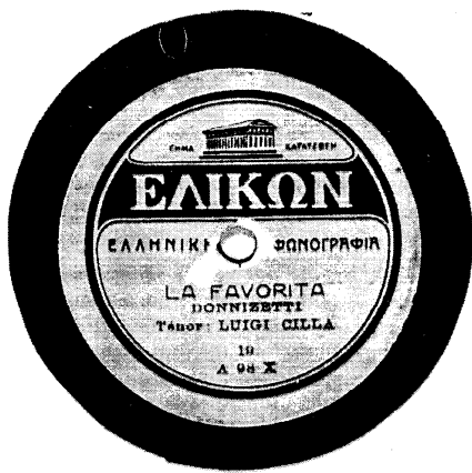
Φωτ. 4 - Η ετικέτα του δίσκου της «ΕΛΛΗΝΙΚΗΣ ΦΩΝΟΓΡΑΦΙΑΣ», που περιέχει το τραγούδι «LA FAVORITA»