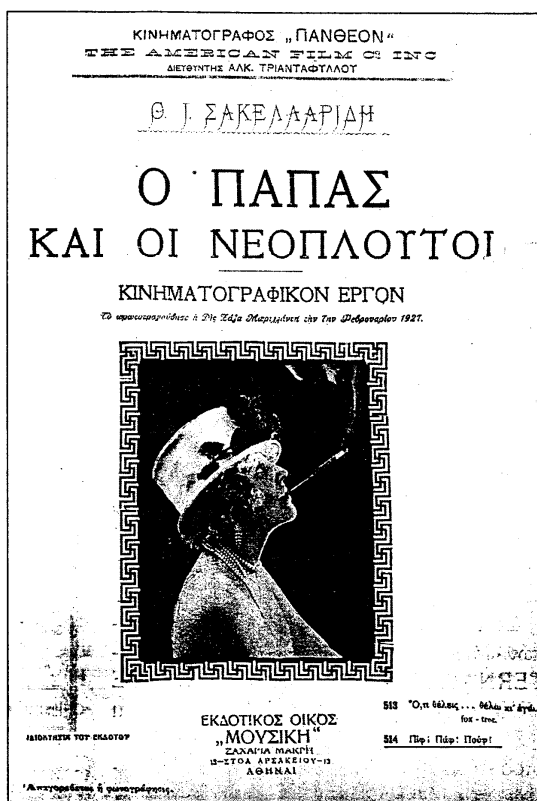
Φωτ. 1 - Η πρώτη σελίδα της παρτιτούρας με το τραγούδι «ΠΙΦ-ΠΑΦ-ΠΟΥΦ»

Ακόμα αναφέρει ότι το πρωτοτραγούδησε η Ζαζά Μπριλάντη, την