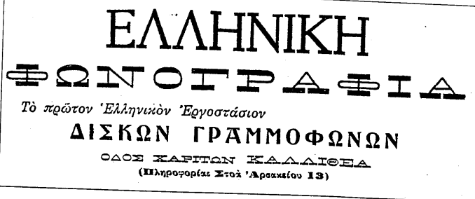
Φωτ. 2 - Μέρος από την τελευταία σελίδα της παρτιτούρας με τη διαφήμιση της «ΕΛΛΗΝΙΚΗΣ ΦΩΝΟΓΡΑΦΙΑΣ»

7η Φεβρουαρίου 1927. Που όμως; Στο θέατρο, στην ταινία, σε δίσκο; Δεν αναφέρει. Πρέπει λοιπόν η παρτιτούρα να κυκλοφόρησε μέσα στο 1927 ή το αργότερο το 1928.