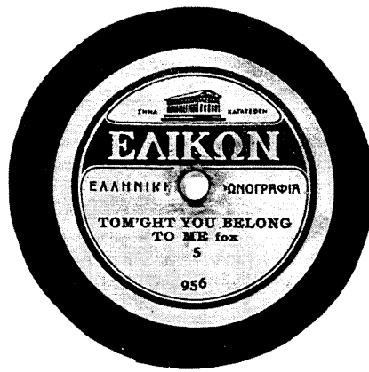
Φωτ. 5 - Η ετικέτα του δίσκου της «ΕΛΛΗΝΙΚΗΣ ΦΩΝΟΓΡΑΦΙΑΣ» που περιέχει το τραγούδι «TOM'GHT YOU BELONG TO ME» (συλλογή του υπογράφοντα)

νο στη διαφήμιση, επιβεβαιώνεται από δυό δίσκους της «ΕΛΛΗΝΙΚΗΣ ΦΩΝΟΓΡΑΦΙΑΣ», που βρίσκονται στα χέρια μας (φωτ. 4 και 5). Ο Ολλανδός ερευνητής Hugo Strötbäum, από τον οποίο ζητήσαμε πληροφορίες σχετικά με το θέμα, μας επιβεβαίωσε ότι η «Ε.Φ.», ήταν το πρώτο εργοστάσιο δίσκων στην Ελλάδα και ότι πράγματι ιδρύθηκε γύρω στο 1925 από το Ζαχ. Μακρή.