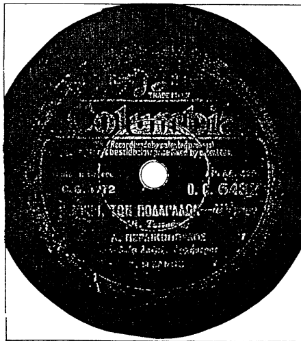
- Εικ. 10. Η ετικέτα του δίσκου που περιέχει το τραγούδι «Η ΜΙΚΡΗ ΤΩΝ ΠΟΔΑΡΑΔΩΝ», του Βασ. Τσιτσάνη.