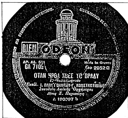
- Εικ. 13. Η ετικέτα του δίσκου που περιέχει το τραγούδι «ΟΤΑΝ ΗΡΘΑ ΧΘΕΣ ΤΟ ΒΡΑΔΥ», του Γ. Παπαϊωάννου.

Βέβαια, δεν μπορούμε να αποκλείσουμε τις περιπτώσεις να του δίνονταν λάθος πληροφορίες ή ακόμα και των τυπογραφικών λαθών. Επομένως, στα δημοσιεύματά του πρέπει πάντα να γίνεται διασταύρωση με τους αντίστοιχους δίσκους. Με την προϋπόθεση, βέβαια, ότι αυτοί υπήρξαν και είναι δυνατόν σήμερα να βρεθούν.